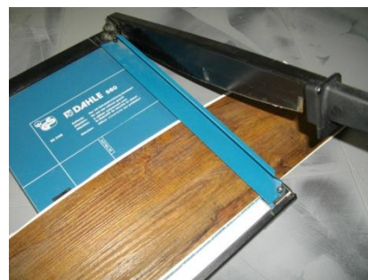
Eenvoudig op maat snijden