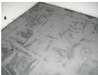
Vloer goed egaliseren